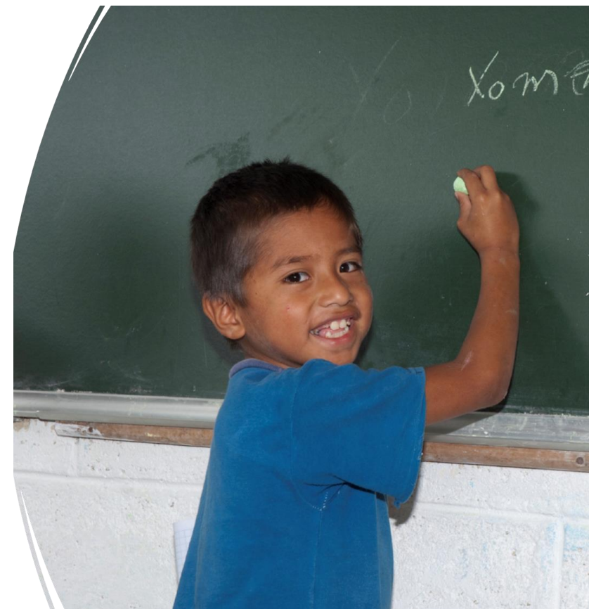
Fotografía de SEP, 2008.